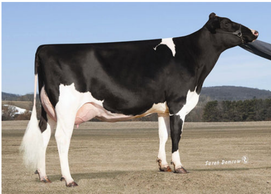
OLSZEWSKI SMORE CLEAN

TIPO 102 Rebaños 271 Hijas 89% Rep. GMACE 24*DEC