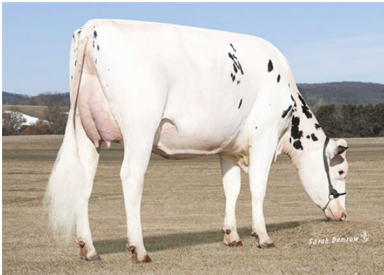
OLSZEWSKI SMORE CUPCAKE