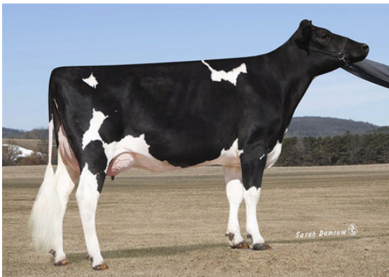
FROST SMORE 6950